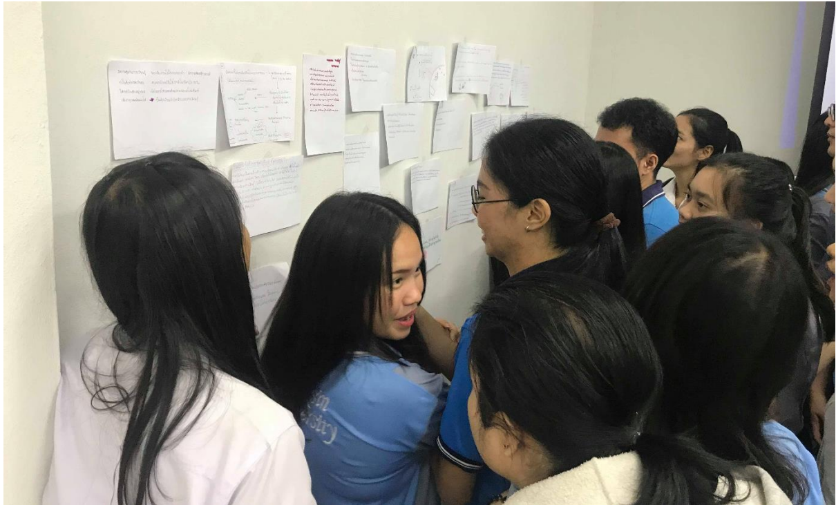
ภาพที่ 1 นิสิตร่วมกันแสดงความคิดเห็นและร่วมกันอภิปรายในหัวข้อ “ครูยุคใหม่ที่เข้าใจเด็ก GEN Z”