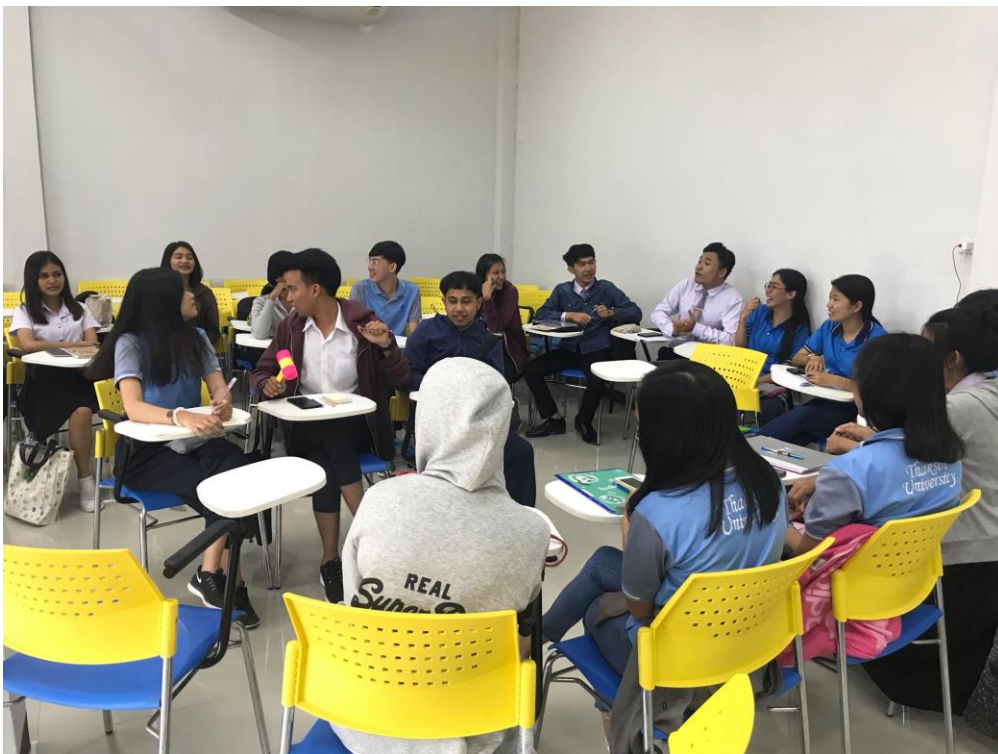
ภาพที่ 3 กิจกรรมการเรียนรู้โดยใช้ปัญหาเป็นฐาน ในหัวข้อ “ครูมีวิธีการจัดการเรียนรู้และปรับทอย่างไรที่ช่วยส่งเสริมและพัฒนาสมรรถนะการเรียนรู้ทางวิทยาศาสตร์ของนักเรียนในศตวรรษที่ 21”